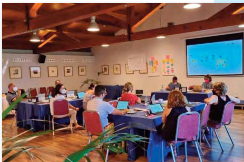
Sessió de reflexió i treball del Comitè d'Ètica