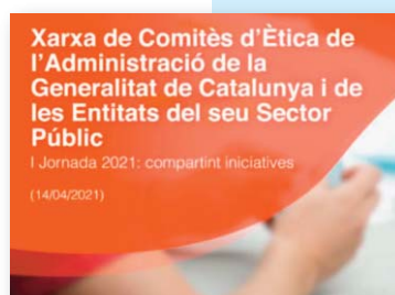
Cartell de la jornada "Compartint iniciatives"

5. Participació en el grup organitzador i en les tres jornades que s'han realitzat durant l'any 2021, per part de la Xarxa de Comitès d'Ètica de l'Administració de la Generalitat de Catalunya i de les Entitats del seu Sector Públic: