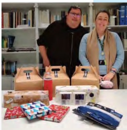
Lliurament al Tren Solidari d'FGC.

Per altra banda, la resta d'obsequis no consumibles es van lliurar a l'associació El Tren Solidari d'FGC, com s'havia fet en els darrers dos anys.