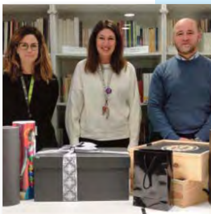
Lliurament al Centre d'Acollida ASSÍS.

Aquest any s'ha incorporat una novetat respecte el que s'havia fet els darrers anys, de manera que, els aliments que s'havien rebut durant el període de Nadal per part del personal d'FGC, i que havien de ser consumits els dies de Nadal, es van lliurar al Centre d'Acollida ASSÍS, associació sense ànim de lucre que ofereix serveis bàsics a persones en situació de sense llar.